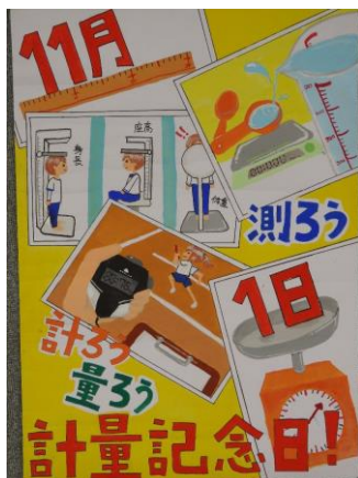
【岐阜県計量協会賞】 羽島市立竹鼻中学校2年 みかみ そら 三上 奏空