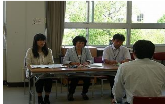
岐阜経済大学での面接指導