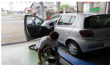
インターンシップ