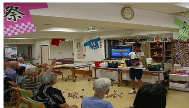
インターンシップ