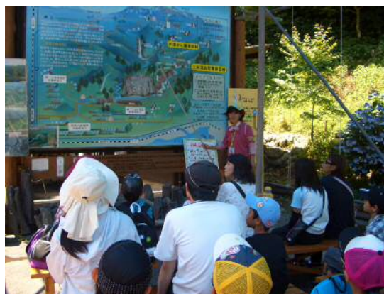
ブリーフィング風景