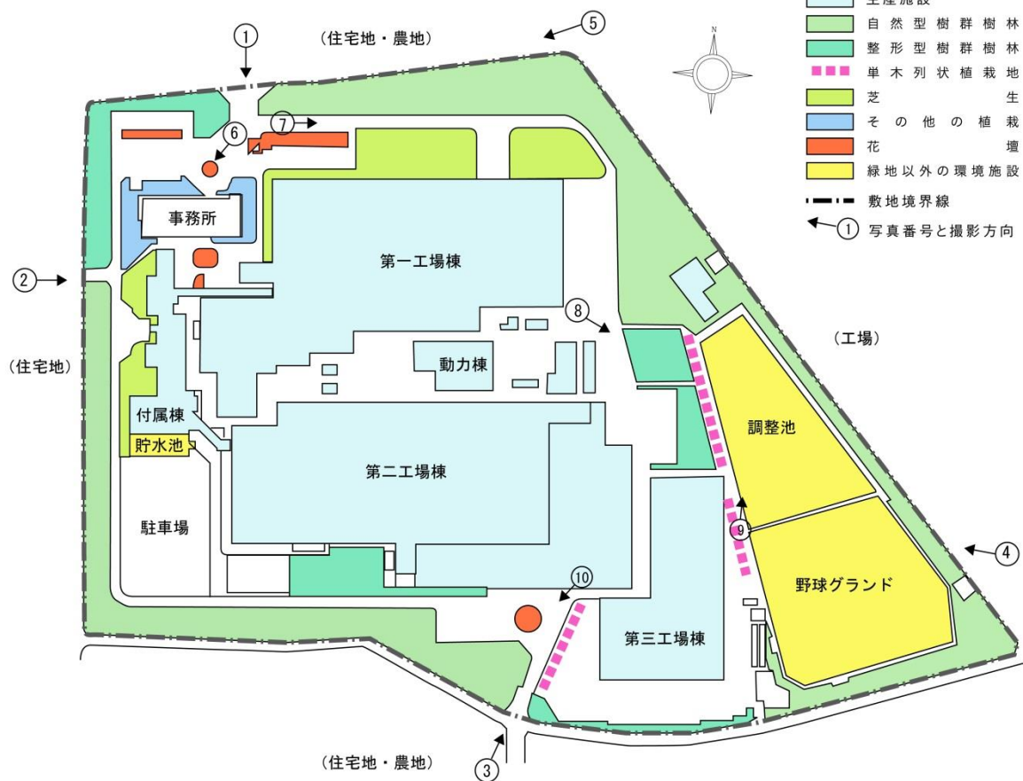
別図 [工場敷地の見取図作成例]

注1) 緑地や環境施設、構造物については、それらの配置が明確に示されていれば、必ずしも作成例のように細かく区分する必要はありません ただし、 緑地については自然型樹群・樹林、整形型樹群・樹林、単木・列状植栽地、芝生等の配置がわかるように示してください (文字によって位置が示されていれば、それで結構です)