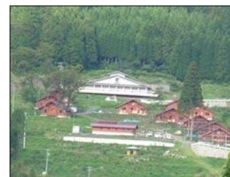
藤橋地域 ワンダ農園