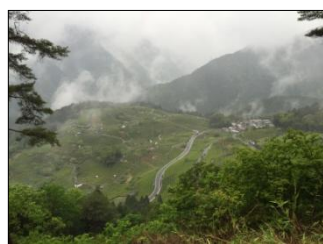
春日地域 天空の茶園 上ヶ流