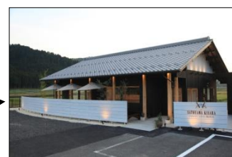
谷汲地域 シヤルキュトリーレストラン里山きさら