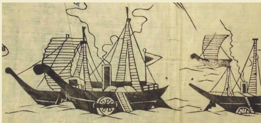
海陸御固泰平鑑(部分) 幕末期

太平洋上に黒船が姿を現し、諸大名が江戸湾沿岸の持ち場でそれに備えている様子が描かれています。