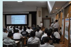
研究・成果発表会