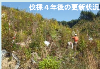
伐採4年後の更新状況