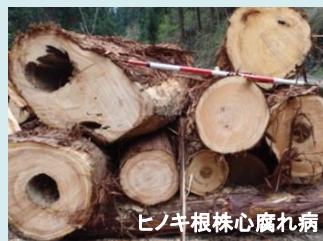
ヒノキ根株心腐れ病