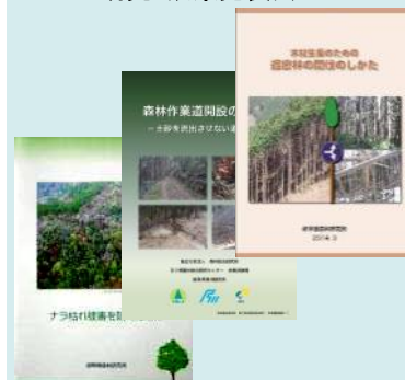
成果をまとめた各種パンフレット