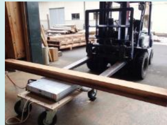
スギ大径材の 加工・利用技術の開発