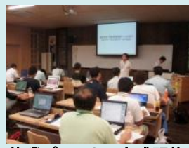
施業プランナー育成研修