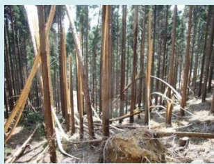
冠雪害発生予測技術の開発