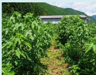
コウゾ高品質化のための 栽培技術の開発