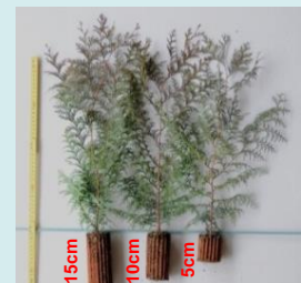
コンテナ苗生産技術の開発