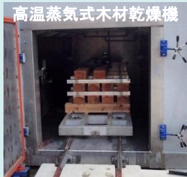
高温蒸気式木材乾燥機