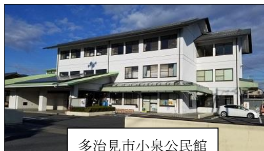
多治見市小泉公民館

小泉公民館では、地域の各団体が連携して地域交流イベントを立ち上げました。公民館活性化委員が地域に呼びかけ、地域史の学習会を開いていた住民を“語り部”としてフィールドワークを行いました。このイベントは、地域の魅力と温もりを感じる「文化と人の新旧交流事業」として、「住みやすいまち＝小泉」を象徴する地域行事に成長しました。