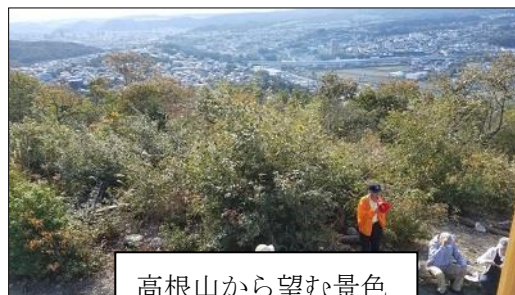
高根山から望む景色

11月17日（土）、晴天のもと「秋を歩こう」ウォーキングが開催されました。スタッフを含めて17名が参加し、公民館活性化委員会の会長が語り部となって、地域に点在する史跡（24カ所）を3時間かけて探索しました。