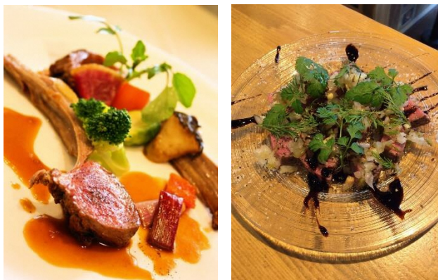
Imagens dos pratos servidos no evento

A província de Gifu está promovendo a carne exótica de cervo e javali nomeando-as como “Mori no Gochisou”