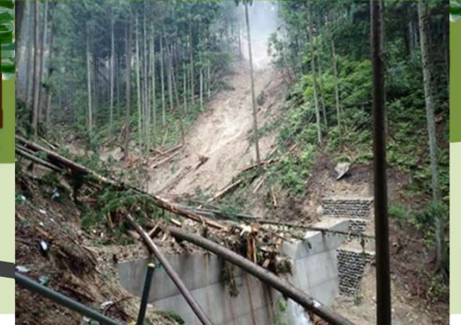
発生源周辺の治山ダム