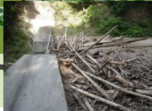
治山ダムによる流出土石の捕捉