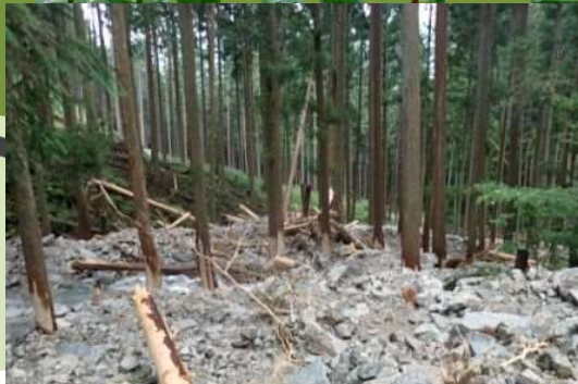
立木による流出土石等の堆積促進