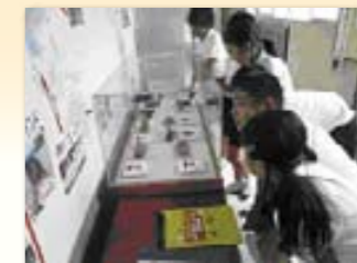
大垣市立静里小学校の様子

今年度から、発掘現場の地元の学校への遺物展示を始めました。これまでに大垣市内の小学校への展示を行いました。展示をした直後に、子どもたちはケースの中の遺物を見て、いろいろな感想を友だちと話し合っていました。