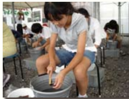
「やさしくたたくようにすると、 土が取れるよ。」