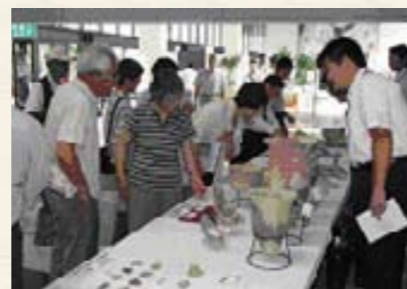
遺物展示を見る参観者