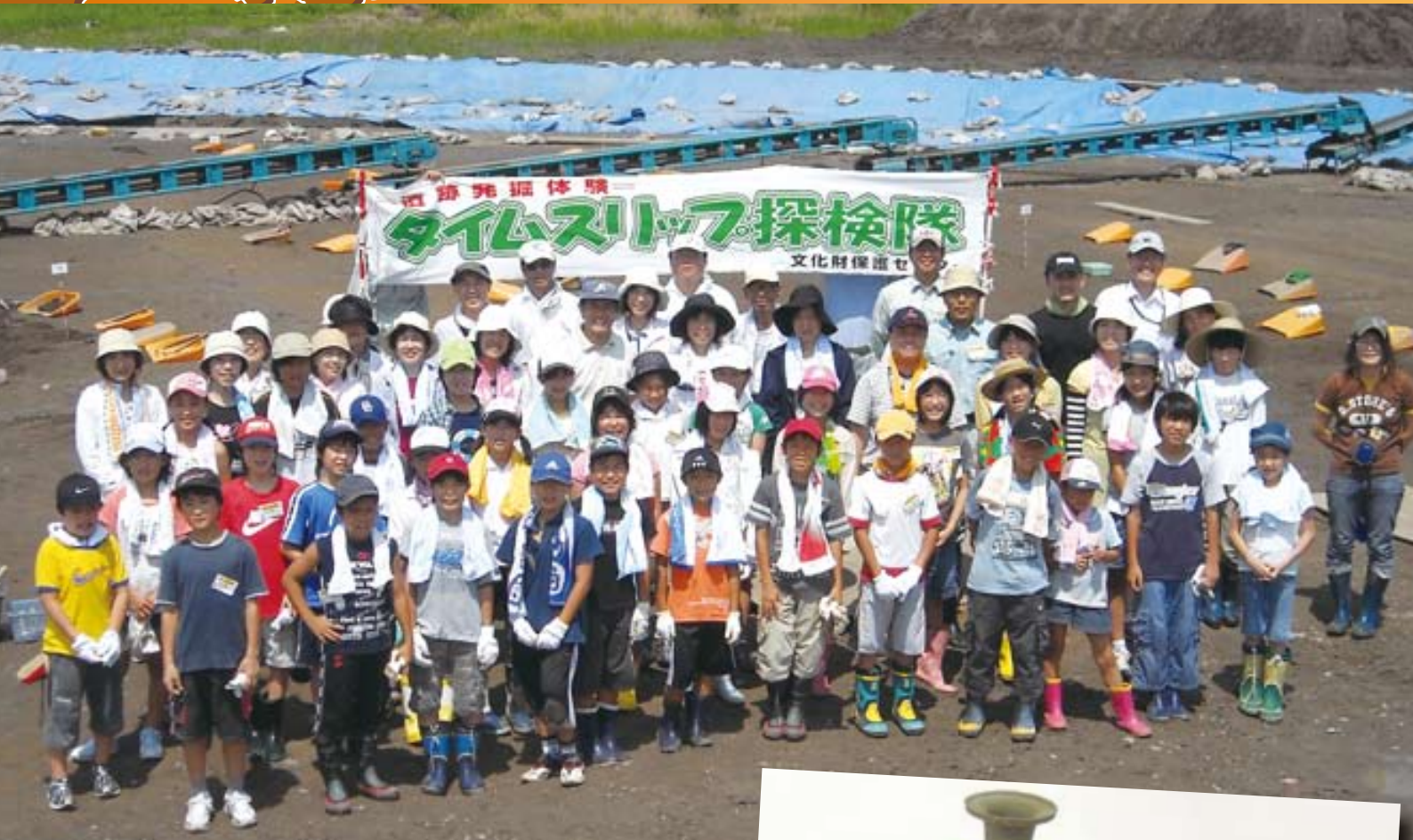
7月 タイムスリップ探検隊に参加された皆さん(荒尾南遺跡)