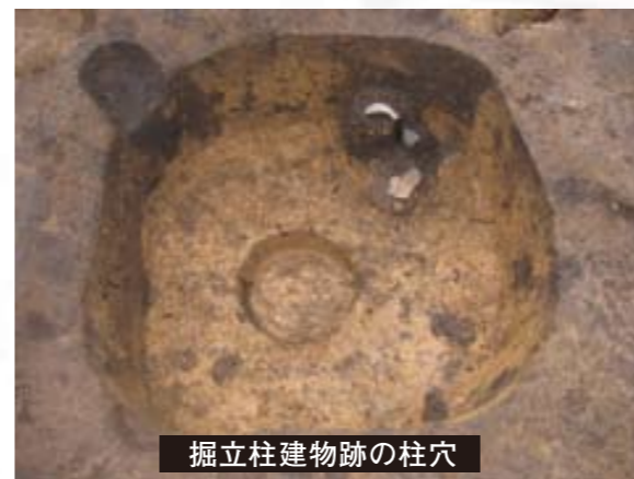
掘立柱建物跡の柱穴