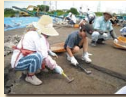
「そうそう、上手に鎌を使えるね。」