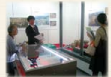
▲風土記の丘学習センター展示の様子

・当センターが近年実施しました発掘調査の成果のうち飛騨地区の3遺跡(ウバガ平遺跡・野内遺跡・三枝城跡)から選んだ約250点の出土遺物を展示します。 ・風土記の丘学習センター(高山市)11月8日まで