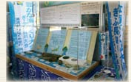
▲東濃西部総合庁舎展示の様子