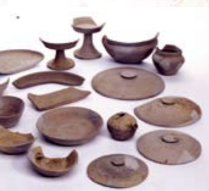
土坑から出土した須恵器