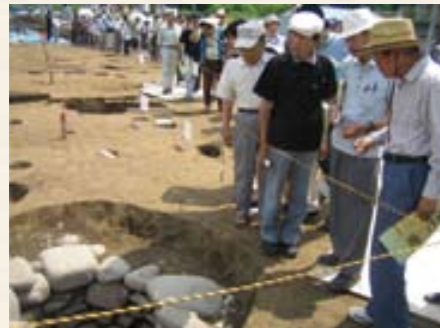
下切遺跡現地説明会(井戸跡を見学する参加者)

当日は天候にも恵まれ、地元下呂市内を中心に125名の参観者があり発掘調査の成果に触れていただきました。発掘調査現場では、江戸時代の井戸跡や鍛冶遺構を熱心に参観される姿がありました。遺物展示会場では、鍛冶作業に用いた送風管である鞆の羽口や瀬戸や美濃地方で作られた江戸時代の陶磁器を間近で見られ、感嘆の声をあげられる姿がありました。「地元でこんなすごい遺跡があるなんて誇りに思います。」という参観者の一言は、発掘調査を担当した調査職員として大変嬉しく思いました。