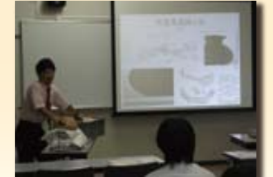
＜遺跡の説明を聞く生徒＞