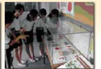
大垣市立宇留生小学校の様子