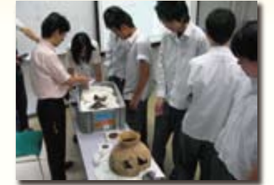
＜土器の特徴を観察する生徒＞