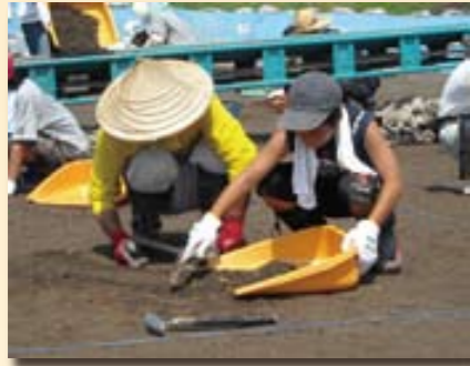
「掘るのでなく、土を削る ようにするんだよ。」