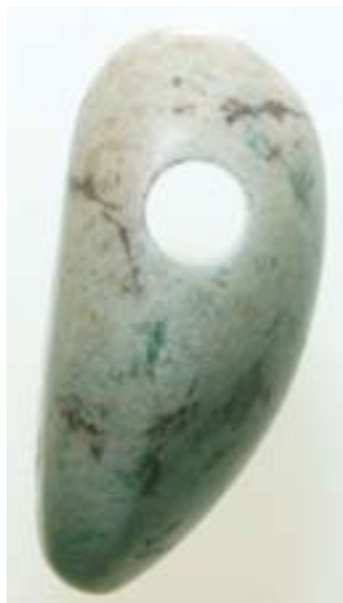
円い管か棒状の錐で 穴をあけた玉 (恵那市大平遺跡出土)