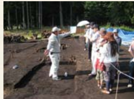
岩田西現地説明会

当日は天候の心配も杞憂に終わり、気持ちの良い天候の中で、地元岐阜市を中心に県外からの参加者も含め242名のみなさんが、発掘調査の成果に触れてくださいました。発掘調査現場では、調査員に方形周溝墓の築造年代を質問されたり、畦畔の見つけ方を質問されたりするなど熱心に見学される方がたくさんみえました。また、遺物展示会場では、実際に土器を手にとり、興味深く観察されるなど、まさに、「見て、触って、感じて」頂けた現地説明会となりました。