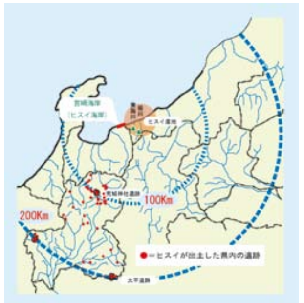
岐阜県内の縄文時代ヒスイ製玉類の出土遺跡分布