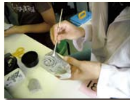
「模様がはっきり見えてきた。」