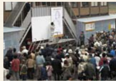
(昨年度の現地説明会の様子)

今年度も大垣市荒尾町で遺跡の発掘調査を行っています。過去3年間の成果を含め今年度の調査状況についての説明会を開催しますので、多数のご来跡をお待ちしています。