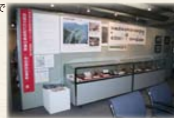
▲県民ふれあい会館展示の様子