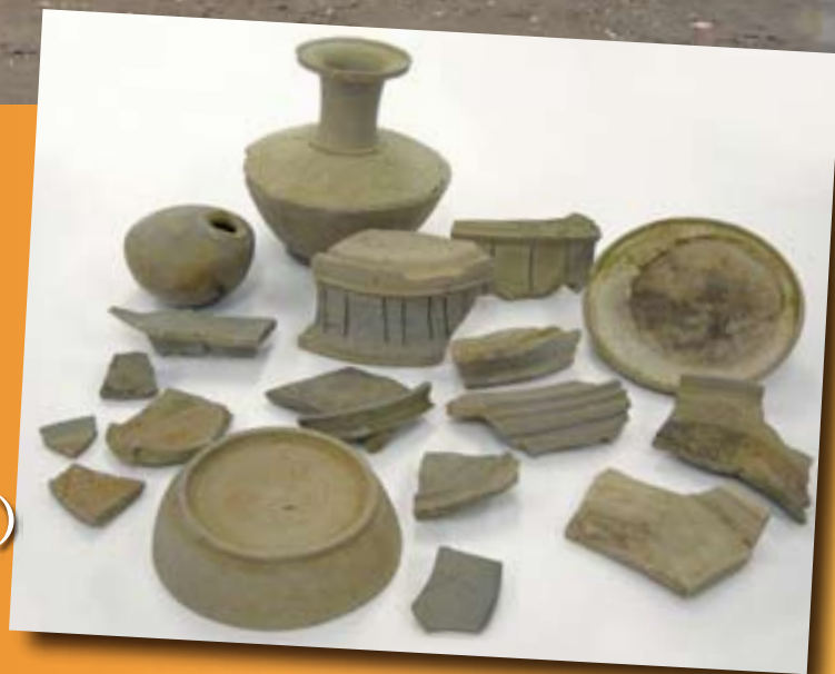
広畑野口遺跡から出土した遺物