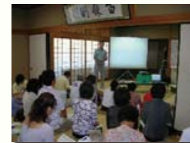
大垣市教員研修会「ふるさと講座」

8月24日(月)に、大垣市西部研修センターと荒尾南遺跡で、大垣市教員研修会「ふるさと講座」が行われ、文化財保護センターから講師を派遣しました。講座内容は、荒尾南遺跡の紹介と体験発掘・発掘現場めぐりです。33名と多数の参加者があり、実体験を交えた有意義な研修となりました。