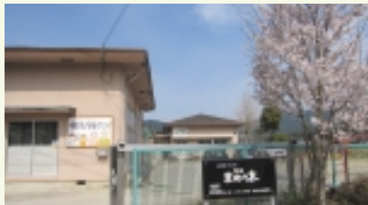
活動拠点「ふれあいセンターまめの木」