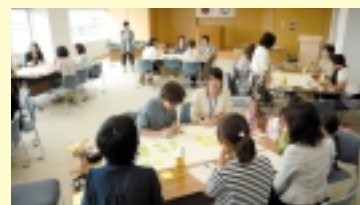
神戸町「神女会議」のグループワーク

地域が抱える課題（防災、子育て支援、防犯、高齢者の見守りなど）の解決につながるヒントを提供する専門家をアドバイザーとして派遣したり、地域住民の間で課題を洗い出し共有するワークショップを行う場合のファシリテーターとして岐阜県コミュニティ診断士（※）を派遣するなど、要望に応じて課題解決の応援をします。