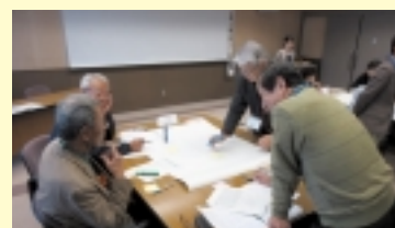
美濃加茂市のグループワーク