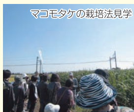
マコモタケの栽培法見学

今後の展望 マコモタケがより一般的な食材として普及するよう、販売先の拡大や行政と協力をして今後もいろいろなイベントを企画し、マコモタケのファンを増やしていく。