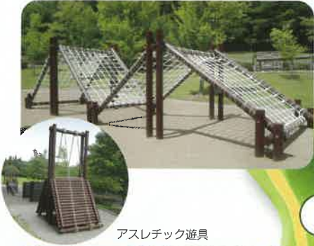
アスレチック遊具

子どもたちが全身を使って楽しく遊び、体力づくりをすることができるアスレチック遊具がある広場です。 ネットラダー、忍者渡り、丸太ブリッジなど