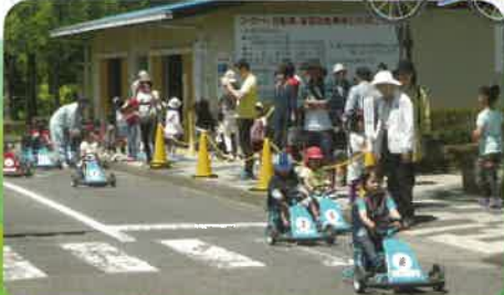
ゴーカート貸し出し

足踏式ゴーカートや自転車で遊びながら、交通知識や正しい交通マナーが覚えられます。 ミニチュア都市には、車道、歩道、信号機、標識、踏切、横断歩道、遊具等があります。 自転車、小学生用ゴーカート、幼児用ゴーカート無料貸し出しがあります。