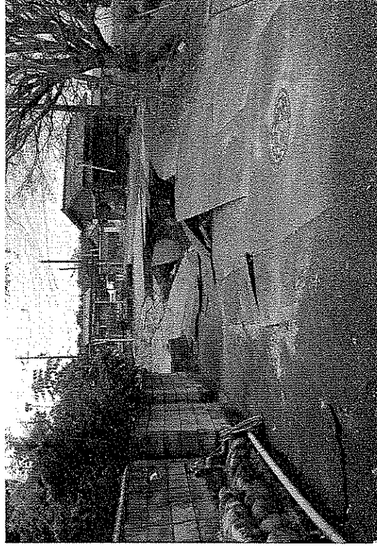
亜炭鉱跡の崩落により道路・住宅に生じた陥没等の被害の例