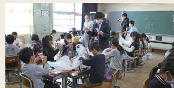
講座 マイ防災ボトルづくり