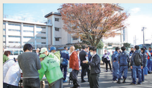
200人以上のスタッフが参加