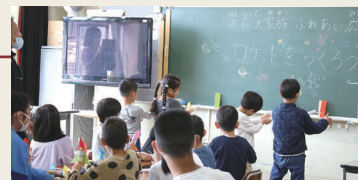
講座 ロケットをつくろう