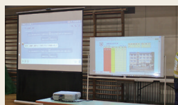
情報を可視化し共有 皆が考え行動できる環境に