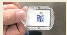
QRコード付きキーホルダー