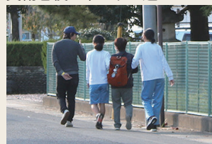
障がい者役に声をかけ腕を組み体育館へ