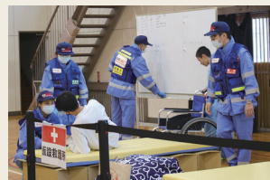
岐阜市民病院の災害派遣医療チーム