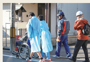
負傷者役を車いすで運ぶ

災害拠点病院となる近隣の岐阜市民病院災害派遣医療チーム(DMAT)も参加。けがの状態に応じて治療の優先順位を決める「トリアージ」を実施。災害時に助ける、地域との連携方法を確認した。