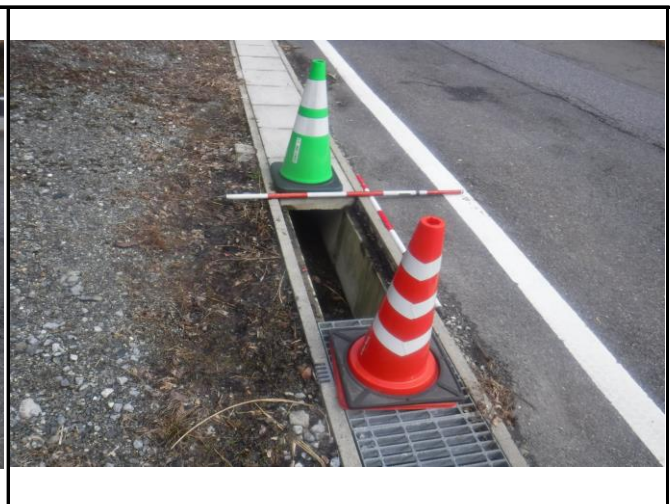
盗難箇所(西から東へ撮影) セーフティコーン設置済み