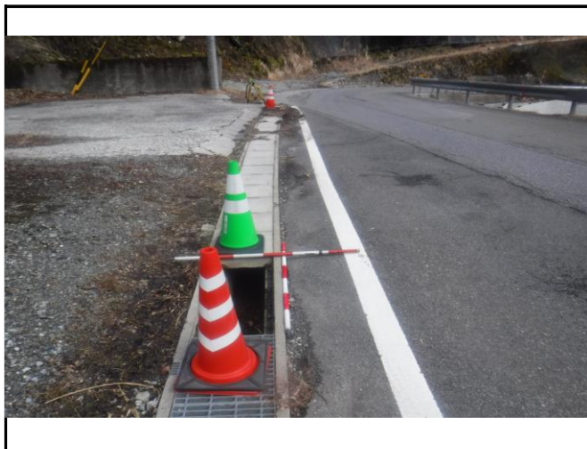
盗難箇所(西から東へ撮影) セーフティコーン設置済み