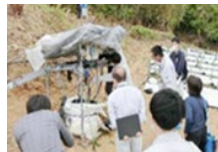
新たな担い手への指導