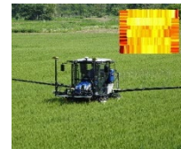
生育センサー付き 可変施肥機