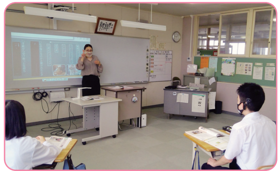
■特別の教科 道徳（中学部）

聴覚障がい者を対象とする特別支援学校では、聴覚に障がいのある幼児児童生徒を対象にして、早い時期から補聴器を使って「音」の存在に気付いたり、「ことば」の力を付けたりするための、きめ細かな指導や自立に向けての専門的な教育を行っています。