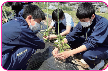
■生活単元学習 (中学校特別支援学級)