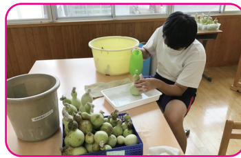
■生活単元学習 (中学校特別支援学級)