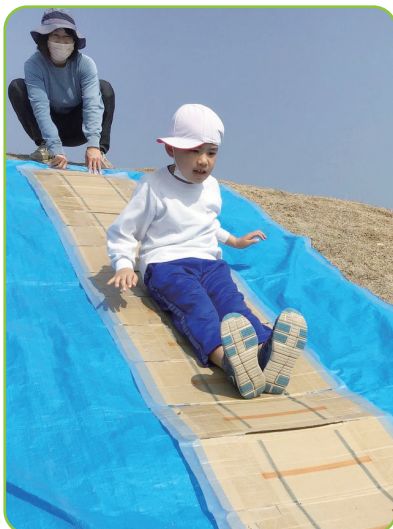
■生活単元学習（小学部）

※平成29年度から知的障がいの程度が軽度の生徒を対象とした高等特別支援学校を設置しました。（「4 高等特別支援学校とは」）