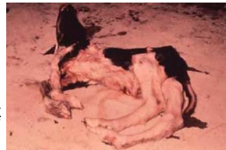
アカバネ病野外感染例