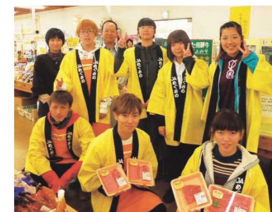
〈対面販売を行った学生〉

平成30年11月2～3日、とれったひろば可児店で農業大学校から出荷した和牛「つくよみ」号の精肉が販売され、畜産学科の学生が対面販売に協力しました。「つくよみ」号は、2学年生のプロジェクト学習で、肥育牛のロース芯面積改善のため、通常の大豆粕より嗜好性の良い加糖加熱大豆粕を給餌した牛です。さらにビタミンEやビタミンCを給餌して肉色や脂肪交雑等肉質の向上も目指しました。 学生からは、「生産された肉がどのように販売されているか知り、今後飛騨牛の生産を頑張ろうと思った」等の感想が聞かれました。