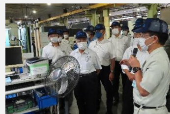
(株)打江精機を視察

運転者講習センターにおける認知機能検査へのタブレット端末導入の取組や、(株)打江精機における障がい者雇用の取組等について調査しました。