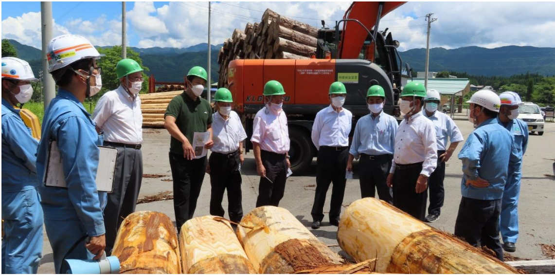
農林委員会視察 令和4年8月5日 ～長良川木材事業協同組合を視察～