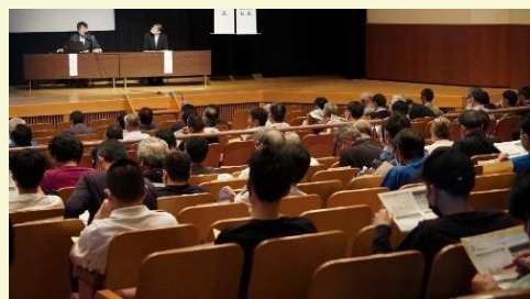
地域指導者育成研修会の様子