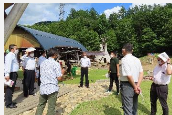
森林総合教育センター(モリス)を視察

(株)ひだキャトルステーションにおける飛騨牛繁殖研修施設としての取組や、森林総合教育センター(モリス)における森林教育の拠点施設としての取組等について調査しました。