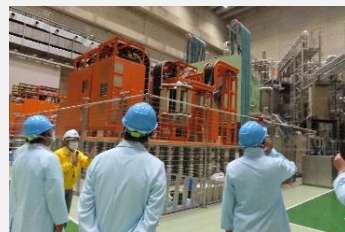
核融合科学研究所を視察

新築校としては全国初の「スーパーエコスクール」である瑞浪市立瑞浪北中学校の施設や、核融合科学研究所における安全で環境負荷の少ない次世代エネルギーの実現に向けた取組等について調査しました。