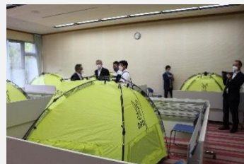
飛騨・世界生活文化センターを視察

県広域防災拠点や市避難所に指定されている飛騨・世界生活文化センターの災害時の活用状況や、白川郷合掌造り家屋の防火・消火体制等について調査しました。