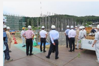
濃飛横断自動車道(中津川工区)を視察

工事が進む中部縦貫自動車道(高山清見道路)や濃飛横断自動車道(中津川工区)、災害関連緊急砂防事業を実施している寺沢川等の現状と課題について調査しました。