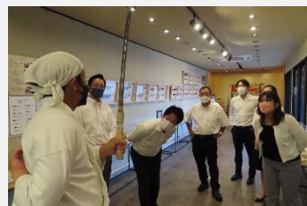
刃物屋三秀関刃物ミュージアムを視察

日本で唯一の刃物に関する体験型複合施設である刃物屋三秀関刃物ミュージアムの取組や、奥飛騨温泉郷中尾地熱発電所における地元の温泉文化と地熱発電の共存共栄を目指した取組等について調査しました。