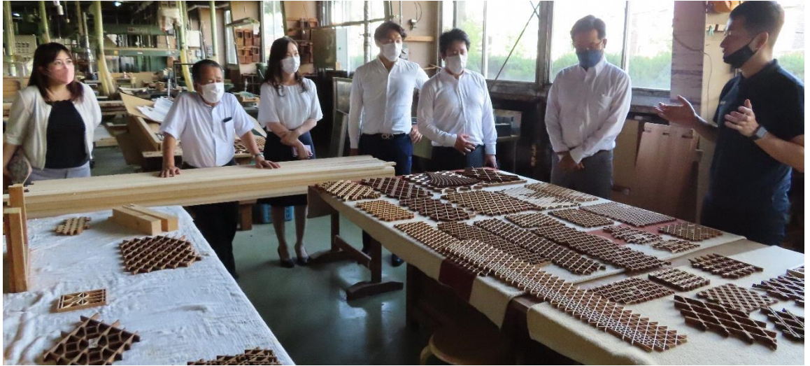
企画経済委員会視察 令和4年8月8日 ～日進木工株式会社を視察～