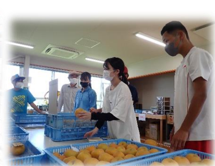
＜体験実習：梨の選果＞