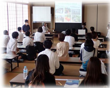
＜学生代表から自治会活動の説明＞

参加者からは、「昼のハウス内があんなに暑いとは思わなかった」「いつもは見られないホルスタイン種を見ることができてよかった」「実習体験では、在校生の方とも話ができて、実際に触れて学べるところがよかった」などの感想がありました。