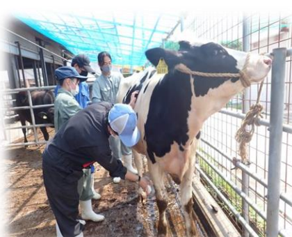
＜体験実習：牛の洗浄＞