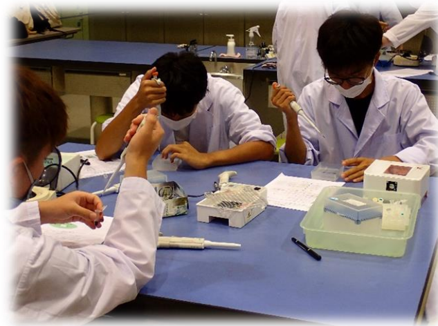
＜PCR検査の実験に真剣に取り組む学生＞