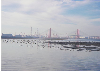
▲藤前干潟 (ラムサール条約登録湿地)

埋立によりその多くが消失してしまいましたが、干潟の様々な機能が知られるようになり、残された干潟を保護する機運が高まっています。