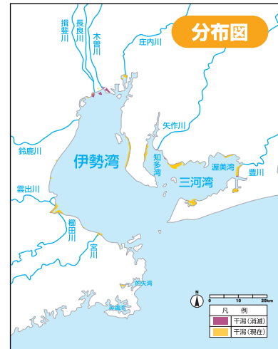
出典: 環境省: 日本の干潟、藻場、サンゴ礁の現況 第1巻(干潟) 1995データを基に作成 提供: 伊勢湾環境データベース