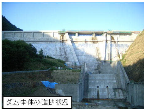
ダム本体の進捗状況

ダム本体工事を完成させ、ダム貯水池に水を貯める試験湛水を平成23年10月から翌年5月頃まで実施し、ダムの安全性を確認した上で、平成24年出水期前（6月）から本格運用を開始する。