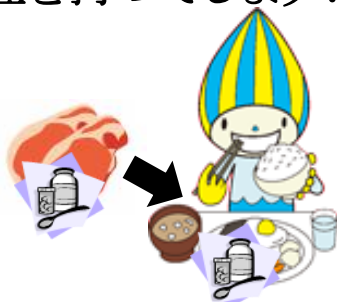
食品中への薬剤残留