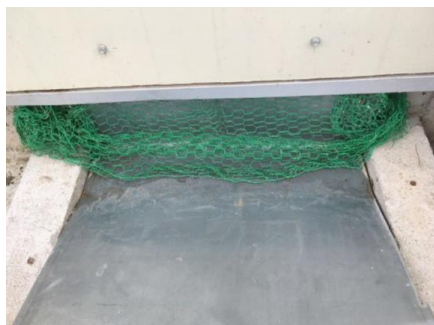
鶏糞ベルト接合部の隙間を亀甲網で塞いだ例