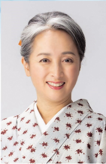
フリーアナウンサー 近藤 サト氏