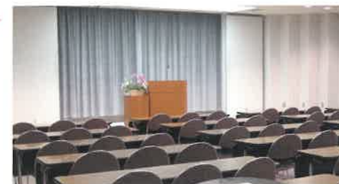
大会議室 ▶ (120人)

会議、研修会、講演会などに利用いただけます。ビデオ、パソコン、DVD等も利用できます。