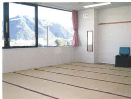
▲和室(7人/11人部屋)32室264名様まで

洋室シングルから和室の11人部屋までビジネスからファミリーまで、幅広く利用いただけます。