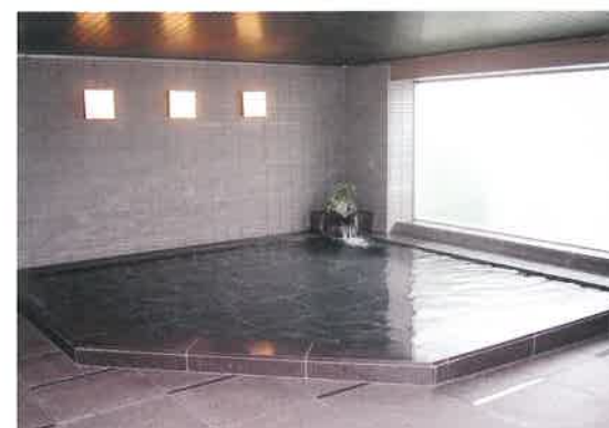
▲大・小浴室 大・小浴室で一日の疲れを取り、リフレッシュ!(ジェットバス付)