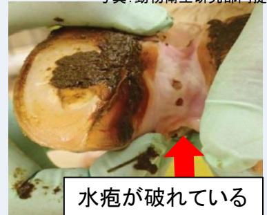
水疱が破れている