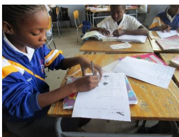
Cone!(円錐)上手にできました!