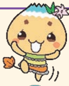
恵那市公式キャラクター「エーナ」

岐阜県南東部に位置し、愛知県と長野県に隣接した、山紫水明の豊かな自然に恵まれた地域です。東には恵那山、南には焼山、北には笠置山に囲まれ、また山あいには木曾川や阿木川、矢作川などが流れ、四季折々の姿を楽しむことができます。大正13年に木曾川をせき止めて造られた大井ダムと恵那峡周辺は、県立自然公園に指定されています。その他、阿木川ダムや矢作ダム、小里川ダムなどのダムもあり、ダムが多い市として知られています。歴史的な観光資源としては、中心市街地を横断する中山道大井宿、南部には800年の歴史を持つ女城主の城下町の岩村、レトロな雰囲気漂う日本大正村がある明智があります。