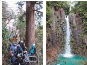
二日目大ヒノキ 高樺の滝

【催行日】 8/20(月)、9/15(土)、9/18(火)、10/13(土)、10/22(月)、11/3(土)、11/12(月) 【料金】 おひとり様1万円 ※最低催行人数 8人 【集合解散場所】 道の駅「花街道付知」(岐阜県中津川市付知町) 【時間】 9:45集合、10:00出発、13:30解散予定 【予約・お問合せ】 細江観光 TEL 0573-79-3322