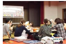
〈絵本の読み聞かせの様子〉

☆役員さんが手づくりで「麴のクッキー」「白玉団子」「アップルケーキ」とお茶を準備。親子でおやつを食べながら、和やかに話すことができるよう工夫。