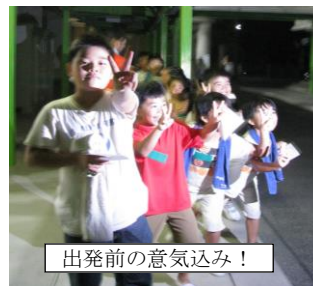
出発前の意気込み!