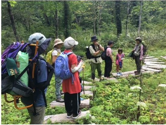
ネイチャーガイドツアー