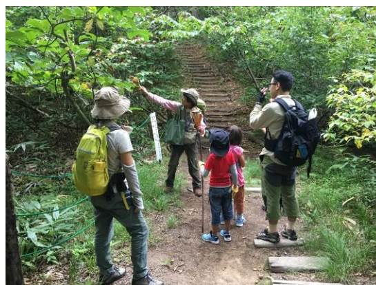
ネイチャーガイドツアー