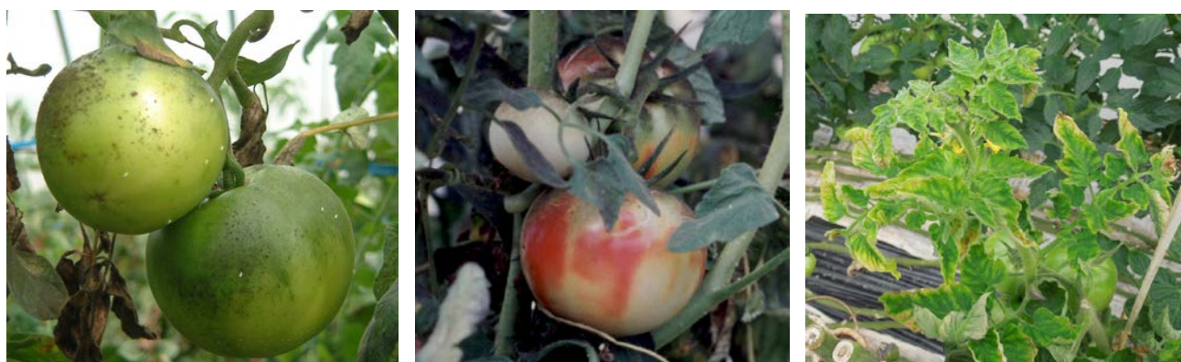
図3 すず病が発生した果実