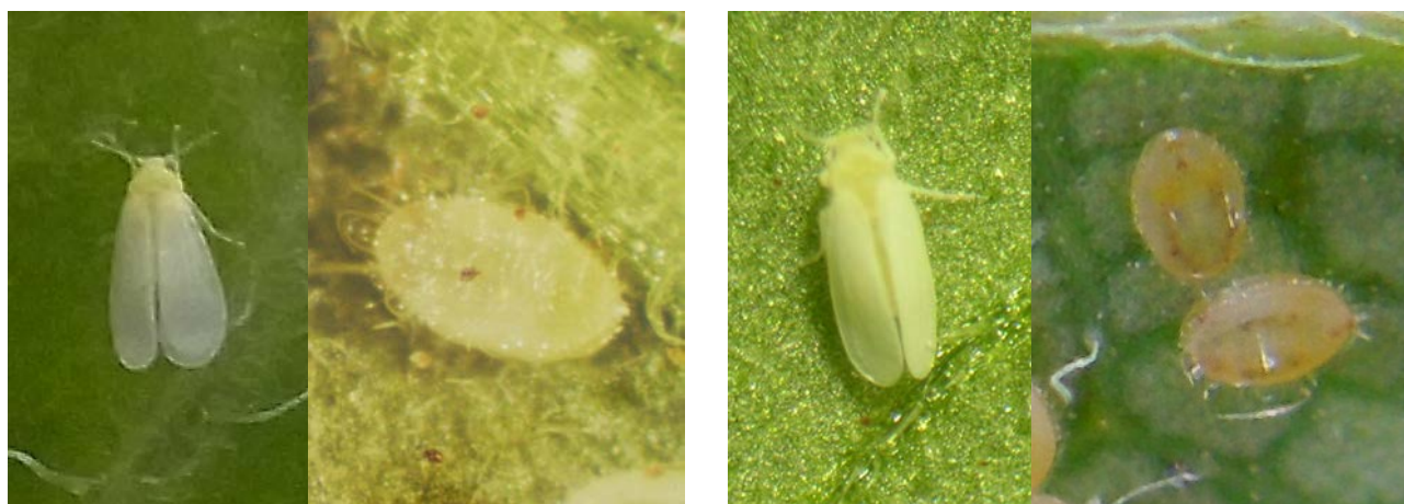
図1 オンシツコナジラミ成虫（左）と幼虫（右） 図2 タバココナジラミ成虫（左）と幼虫（右）