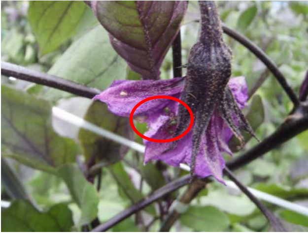
図1 アブラムシ類 (赤丸内)