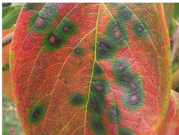
図2 発病葉（円星落葉病）