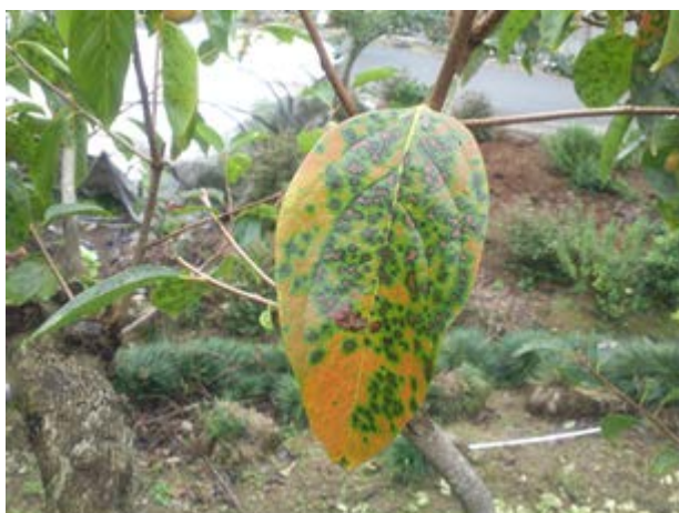
図1 発病葉（円星落葉病）