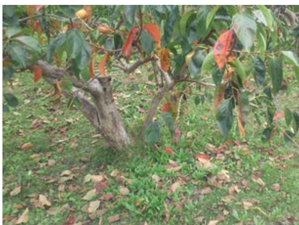
図4 発病による早期落葉