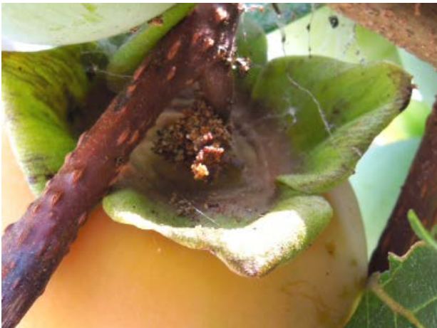
図3 果実への食入部