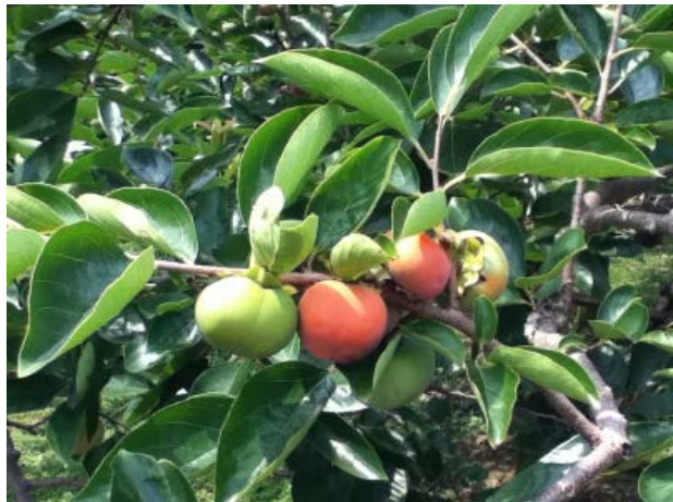
図4 第2世代幼虫による果実被害