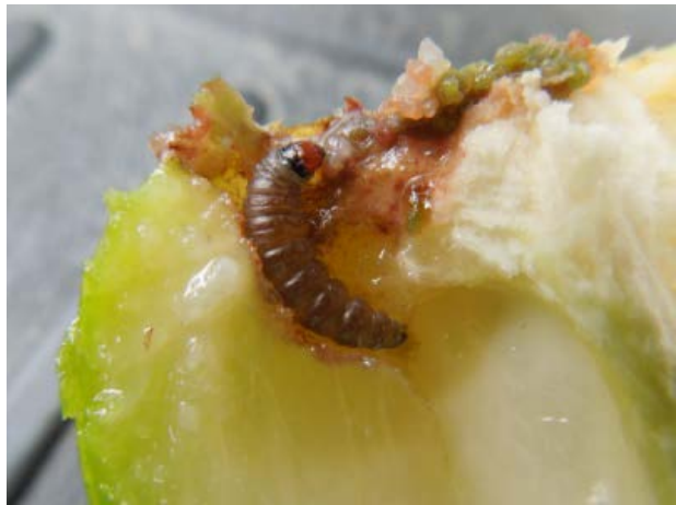
図2 老熟幼虫（体長約10mm）