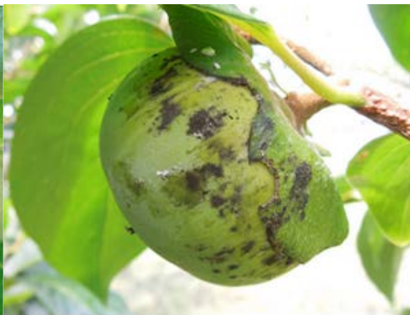
図4 排せつ物に発生したすす病