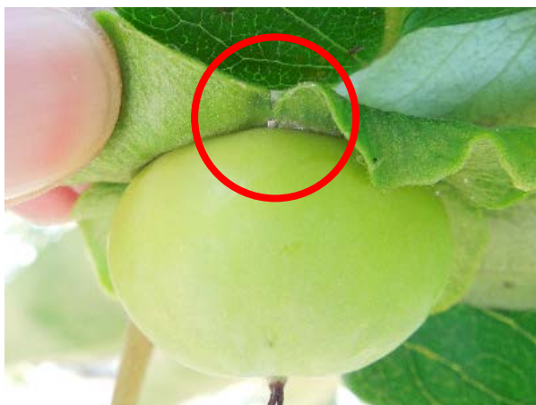
図3 幼果への寄生（○内）