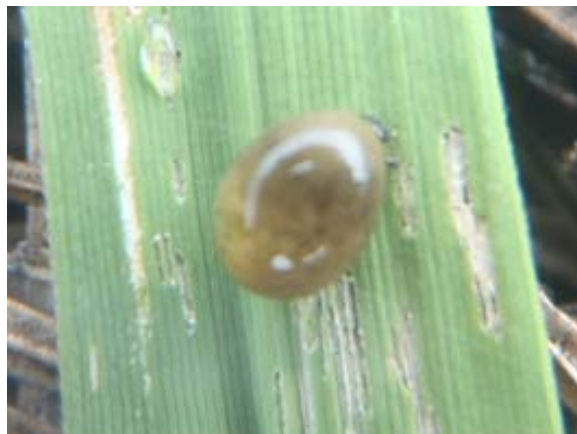
図2 イネドロオウムシ幼虫