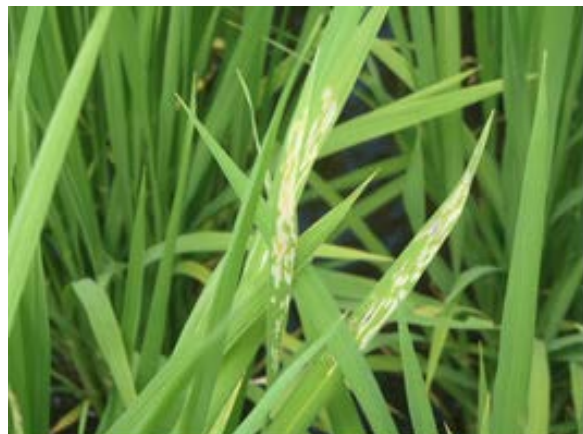
図1 イネドロオウムシによる被害（葉）