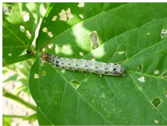
図2 老齢幼虫（体長約40mm）