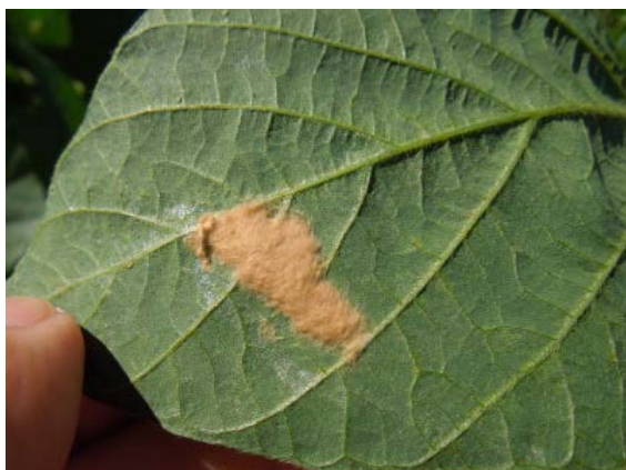
図3 大豆の葉に産み付けられた卵