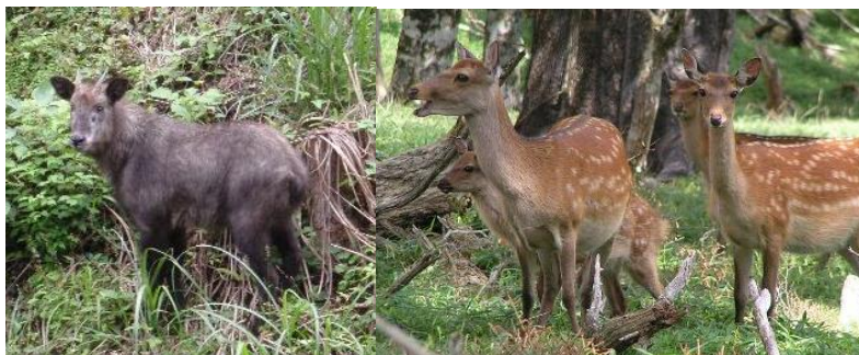
カモシカ（青で斜線）