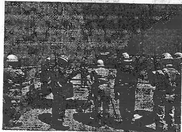
防波壁設置工事点検の様子

* 自主的に取り組んできた重大事故対策や、2013年7月に施行された原子力規制委員会の新規制基準を踏まえ追加した対策工事などのことです。