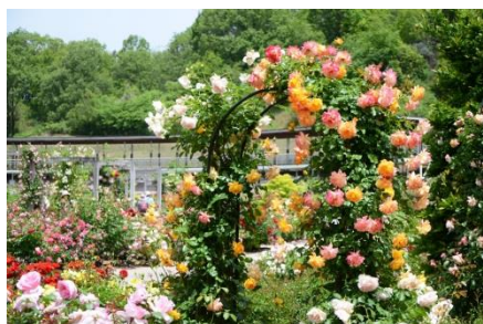
Jardim temático de rosas

Será realizado o Festival de Rosas da Primavera no “Parque Comemorativo do Festival de Flores”, um dos