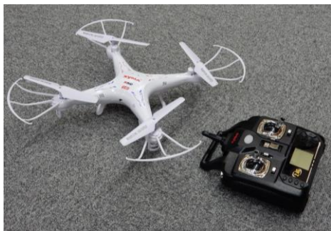
〈ドローン〉 ※イメージ